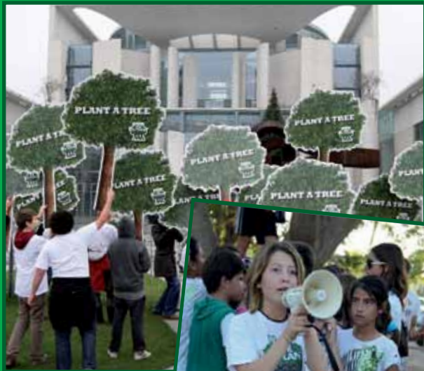
December 2009 voor het kantoor van de kanselier in Berlijn

Terwijl anderen discussiëren, planten wij bomen.