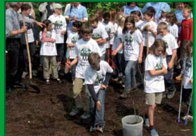
Ensemble, faisons des projets et plantons des arbres!

Dans notre initiative scolaire et notre fondation, nous, les enfants et les adolescents, avons la parole! Chaque année, nous élisons notre conseil mondial d'administration. Jusqu'en 2020, nous voulons transmettre notre enthousiasme à un million d'enfants et de jeunes dans 20 000 académies pour qu'ils deviennent ambassadeurs du climat équitable ou ambassadeurs d'un avenir meilleur. Ensemble, nous pouvons obtenir beaucoup! Klaus Töpfer et le Prince Albert de Monaco sont nos parrains.