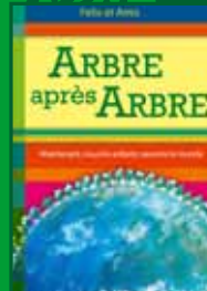
Arbre après Arbre. Maintenant nous, les enfants sauvons le monde (en 8 langues-12,90 euros)