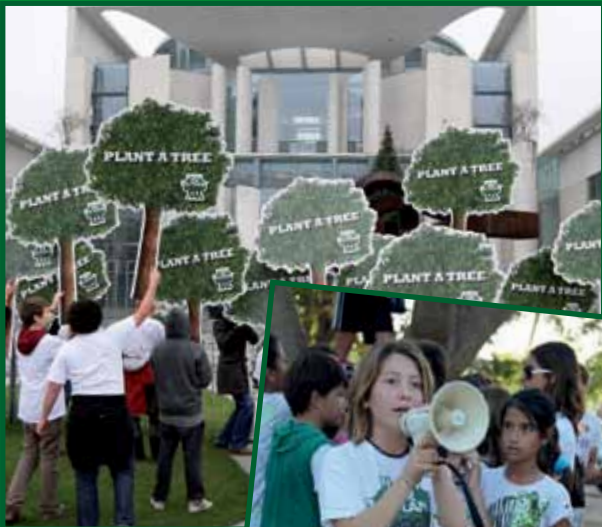
Le 9 décembre 2009 devant la Chancellerie fédérale à Berlin.