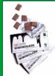
«Le bon chocolat» vendu actuellement en Allemagne, Autriche et Suisse