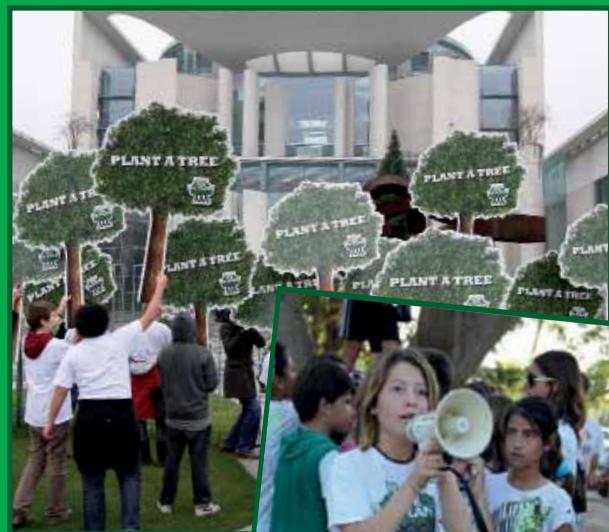
December 2009 voor het kantoor van de kanselier in Berlijn

Een kinder-initiatief eist klimaatrechtvaardigheid.