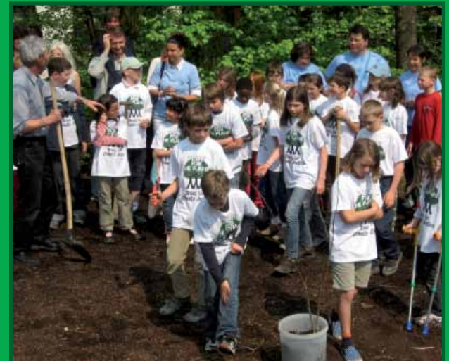
Samen plannen maken en planten

In onze stichting hebben de kinderen het voor het zeggen: de kinderraad beslist en de volwassenen ondersteunen ons. We zijn in de hele wereld actief- er doen al kinderen uit 70 landen mee. Tot eind 2020 willen we 1.000 academiën per jaar organiseren en een miljoen ambassadeurs voor klimaatrechtvaardigheid opleiden!