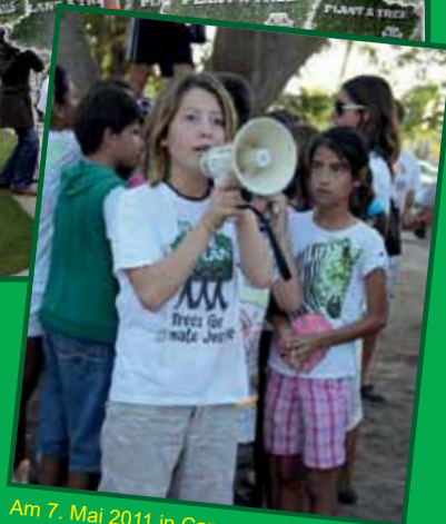
Am 7. Mai 2011 in Cancun, Mexiko. Kinder demonstrieren für eine bessere Zukunft

Laat ons in elk land op de wereld één miljoen bomen planten!