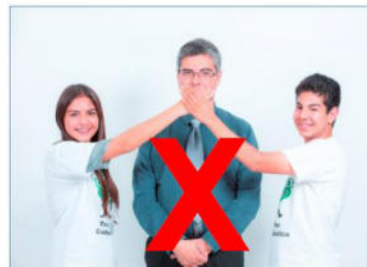
Nur ein Kind und ein Erwachsener!