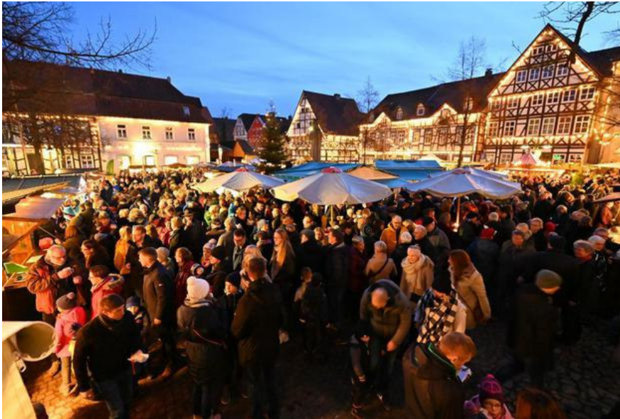
Die stimmungsvoll beleuchteten Häuser der Warburger Altstadt haben zu dem tollen Ambiente des Weihnachtsmarktes beigetragen. Am Wochenende war es zwischen den 35 Buden zwischenzeitlich proppenvoll – trotz des wechselhaften Wetters.