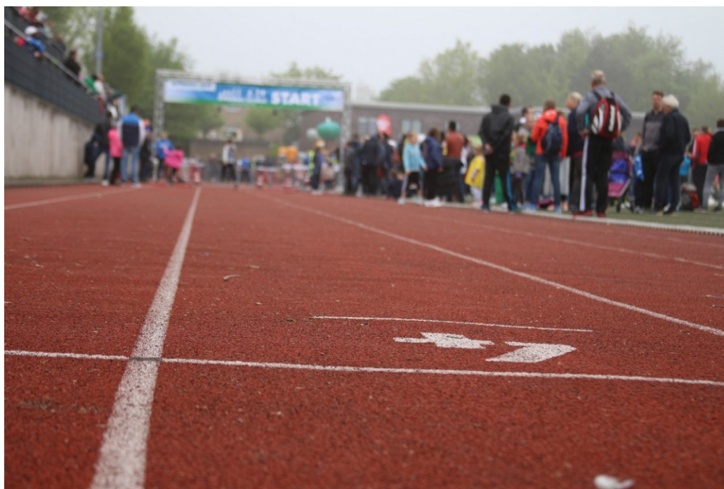
Start und Ziel definiert in diesem Jahr jeder Bachlauf-Teilnehmende für sich.

Mettmann. Bislang war fraglich, ob der Bachlauf in diesem Jahr stattfinden würde. Nun steht fest: der Mettmanner Traditionslauf wird in eine Corona-taugliches Format überführt. Los geht es am 1. Mai; die Anmeldephase läuft.