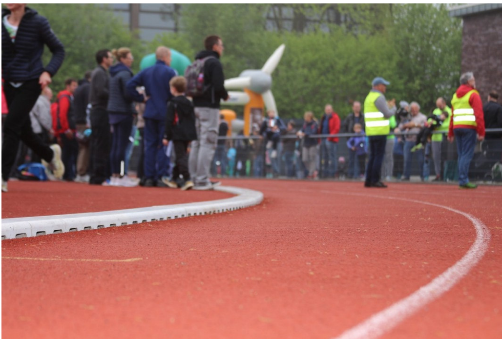
Eine ungewöhnliche Zielsetzung in diesem Jahr: Je weniger Läufer man auf der Strecke trifft, desto besser.

Als Motivation: Unter allen, die ein Foto von ihrer persönlichen Strecke einsenden – die bei der Anmeldung zugeteilte Startnummer muss darauf zu sehen sein – verlost Mettmann-Sport insgesamt 15 Plätze für den Bachlauf 2021. Eindrücke vom Lauf werden in den Sozialen Medien zu sehen sein, wer selbst einen Beitrag teilen möchte, sollte den Hashtag #BachlaufmitABSTAND verwenden.